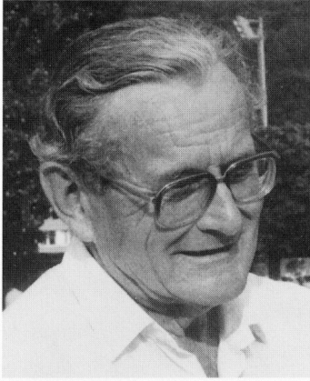
Peter Streit 1916–1993