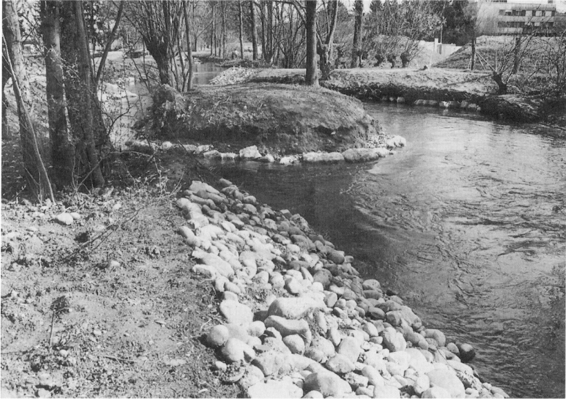
Das künstlich angelegte Mäanderbett der voraussichtlich von künftigen Überschwemmungen befreiten Langeten unterhalb der Mühle.