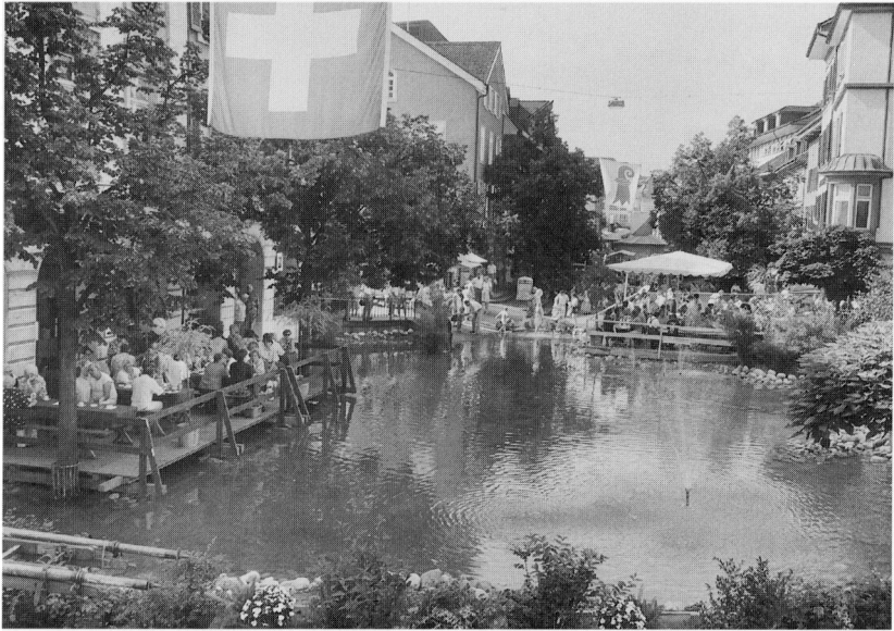
Der «Langenthaler See» in der Marktgasse, Sommer 1993.