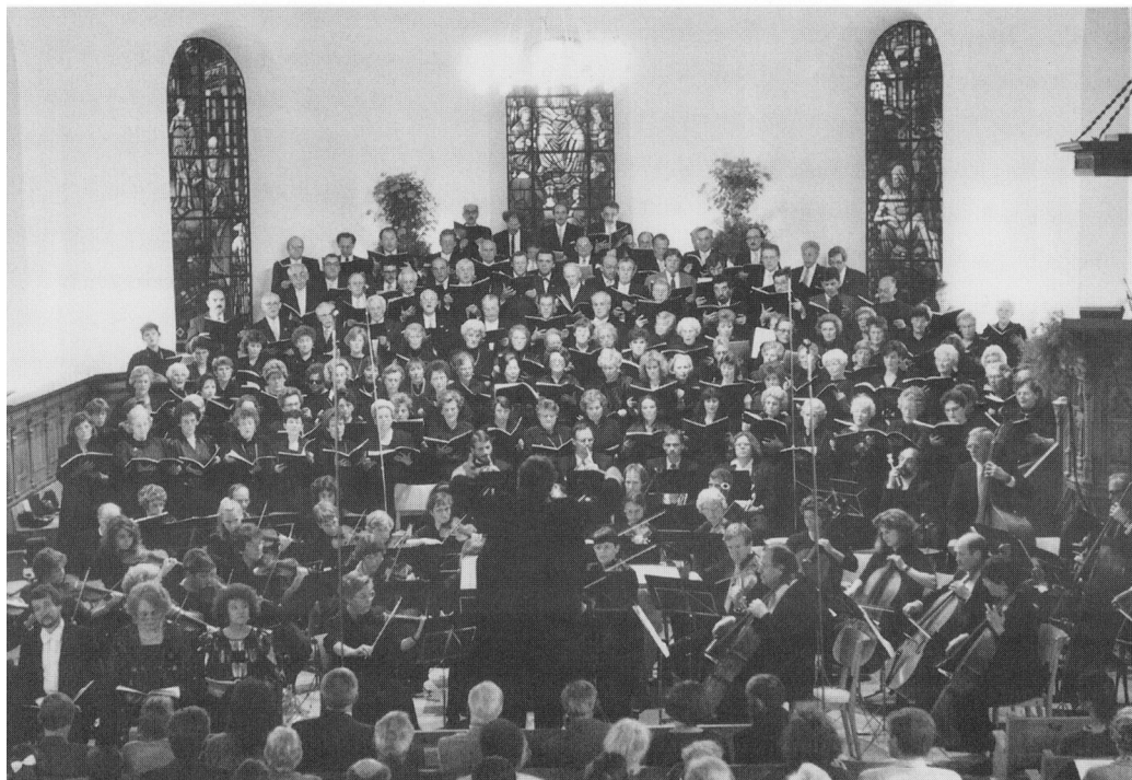
150-Jahr-Jubiläum Männerchor Langenthal. Beethoven: Messe in C, in der reformierten Kirche Geissberg, 8. Juni 1991. Vgl. Chronik S. 276.