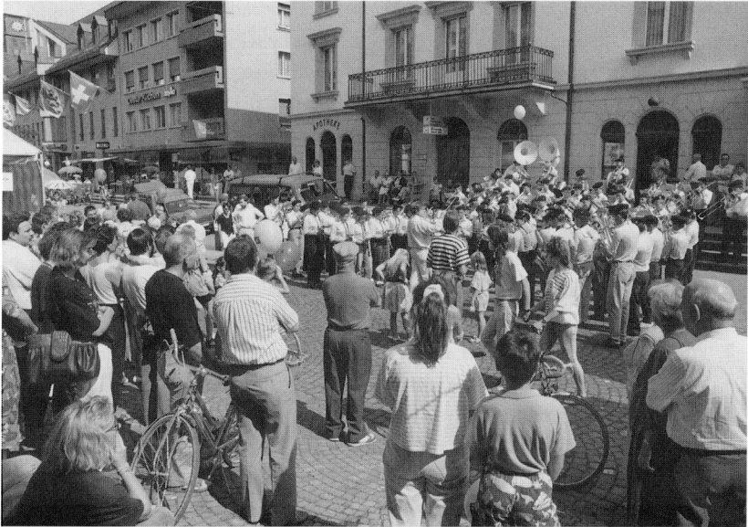
Der Begegnungstag vom 31. August 1991. Die Kadettenmusik spielt in der Markt-gasse.