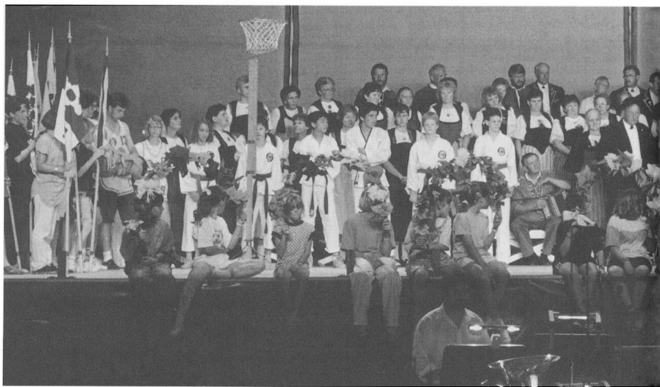
Festspiel «Langenthal im Bärnbiet lyt». Gesamtbild der Mitwirkenden in der Festhütte beim Waldhof.