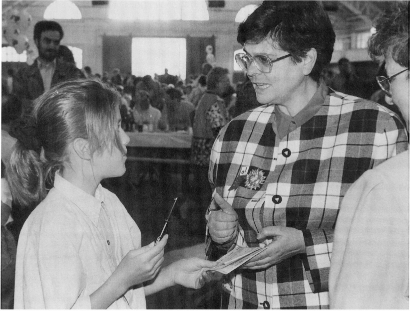
Bundesrätin Ruth Dreifuss, eben erst im Amt, nach ihrer Rede an der 1.-Mai-Feier in der Markthalle 1993, im Gespräch mit der Jugend.