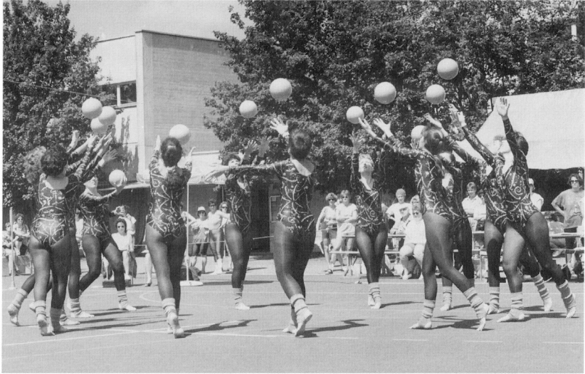
Frauliche Anmut in der Ball-Gymnastik am 47. Bernisch-Kantonalen Turnfest 1993 in Langenthal.

Überbauung ist ein Werk der Pavos-Anlagestiftung Olten, die Pensionskassengelder verwaltet.